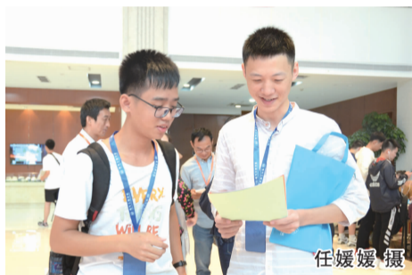
喜上眉梢：阅读给新生的一封信