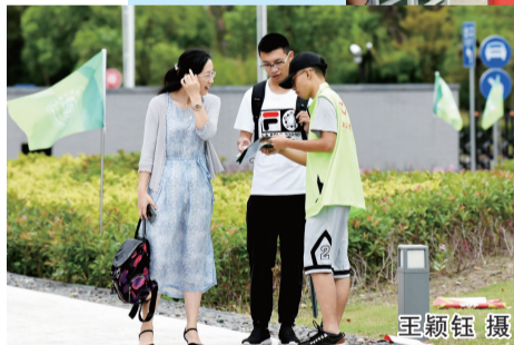
指点路径：志愿者热心帮助新生