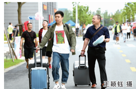
满眼新鲜：新生带着行李来报到