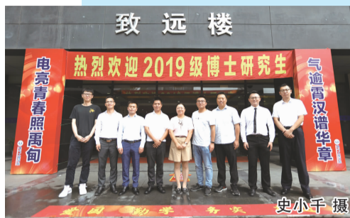
一字排开：学校首届九位博士生来报到